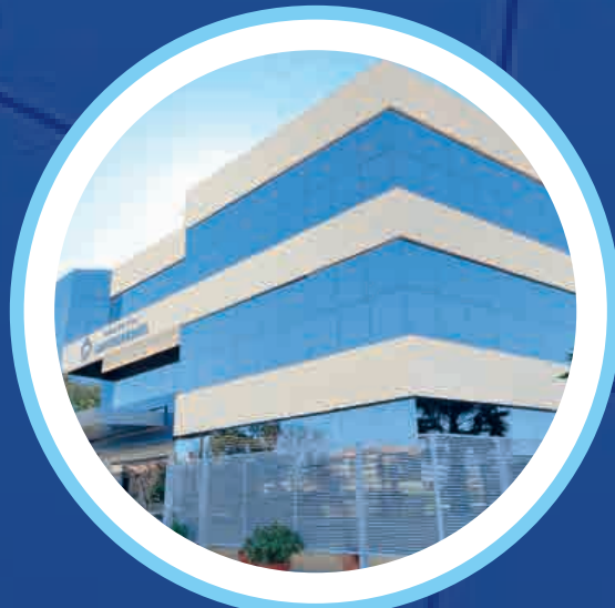
Hospital Santa Marina