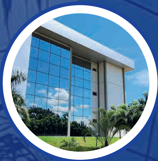
Hospital Proncor C. Cachoeira