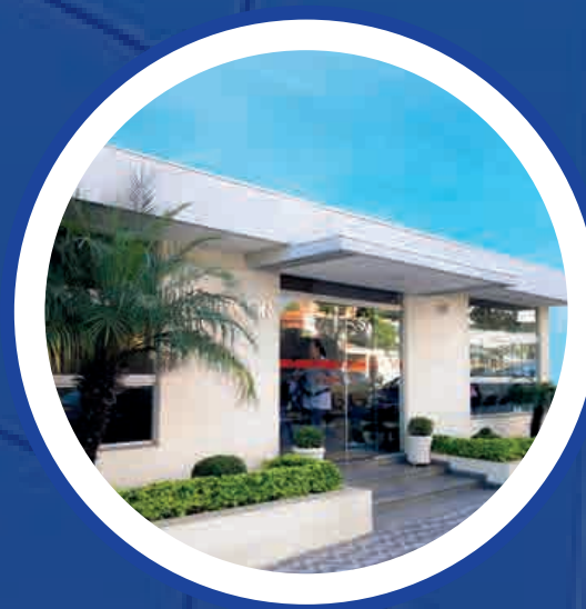
Hospital Proncor Centro