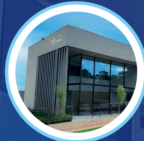
Centro Médico Proncor